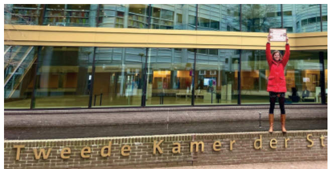
Maartje op de barricaden