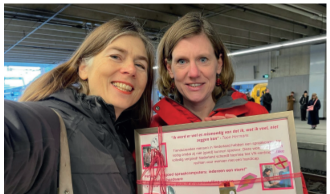
Mannin (I) en Maartje op weg naar de Tweede Kamer

Nogmaals dank voor de aandacht en persoonlijke verhalen die gedeeld zijn naar aanleiding van deze petitie. Wordt vervolgd!